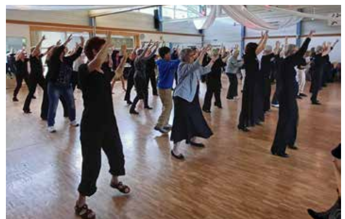
Das Tanzangebot fürs Publikum wurde rege genutzt.