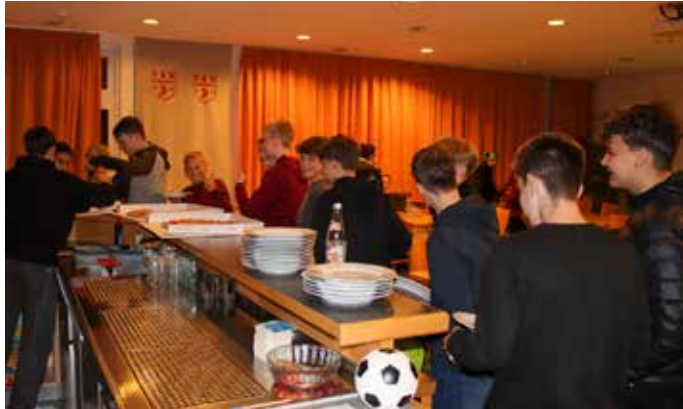
Pizza und Spezi im gemütlichen Teil

Freie Getränke und Pizza sorgten für das leibliche Wohl, während wir uns gemeinsam das Video unserer gerade erst stattgefundenen C-Jugendausfahrt nach Sonthofen anschauten. Hier durfte noch mal ausgiebig in Erinnerungen geschwelgt werden!