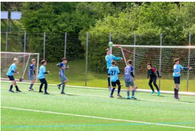
Die Abwehr steht