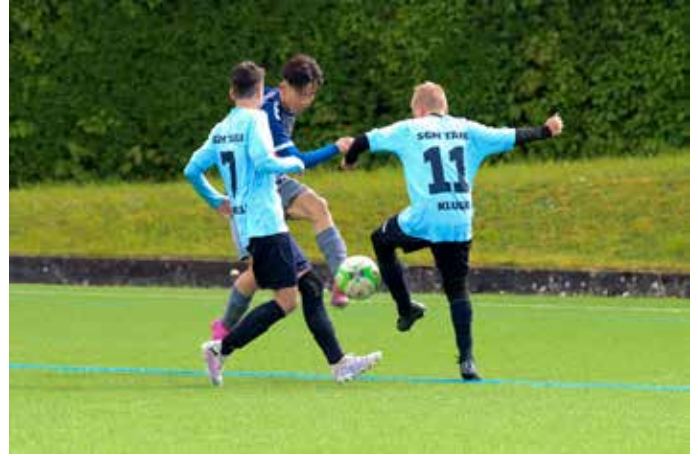
man hilft sich!