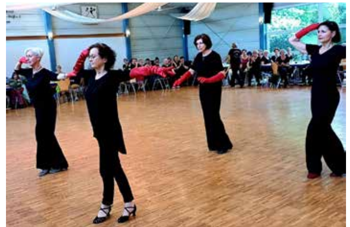
Lady Solo präsentiert den Jive